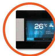
Termostat pokojowy z możliwością sterowania parametrami kotła z dowolnego miejsca w domu