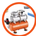
Automatyczne czyszczenie palnika i wymiennika kotła sprężonym powietrzem