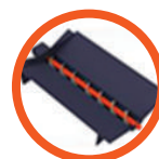
Automatyczne usuwanie popiołu