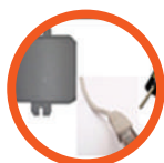
Moduł dla RT10 - bezprzewodowy