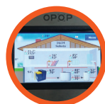
Regulator pokojowy RT10