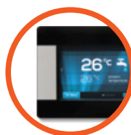
Termostat pokojowy z możliwością sterowania parametrami kotła z dowolnego miejsca w domu