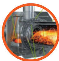
Palnik do spalania pelletu gorszej jakości